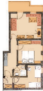
2. Stock Süd

2 - 4 Personen, ca. 60 qm (9) 3-Raum-Wohnung, 2 Stock mit Südbalkon, Geschirrspüler, Mikro Heißbluttherd und gr. Cerankochfeld, zusätzl. Couch für 2 Personen