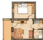
1. Stock West

2 Personen, ca. 33 qm (6) zusätzl. Couch, Mikro für 2 Personen