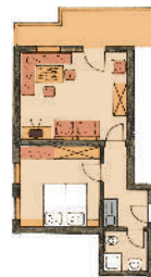
2. Stock Süd

2 Personen, ca. 43 qm (7) 2 Stock mit Südbalkon, Geschirrspüler, Mikro und gr. Cerankochfeld zusätzl. Couch für 2 Personen