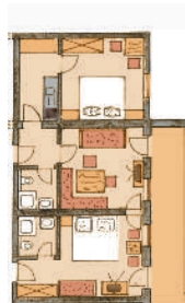
1. Stock Ost

2 - 4 Personen, ca. 65 qm (1) 3-Raum-Wohnung mit zwei Schlafzimmern u. 2x DU/WC, Geschirrspüler, Mikro und gr. Cerankochfeld, 2 TV Vermietung ab 6 Tage